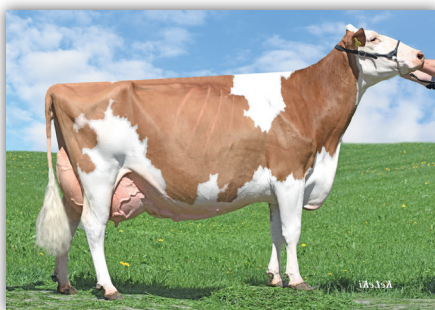
Championne Red Holstein PAPALUNA Krummenacher Konrad, Hasle