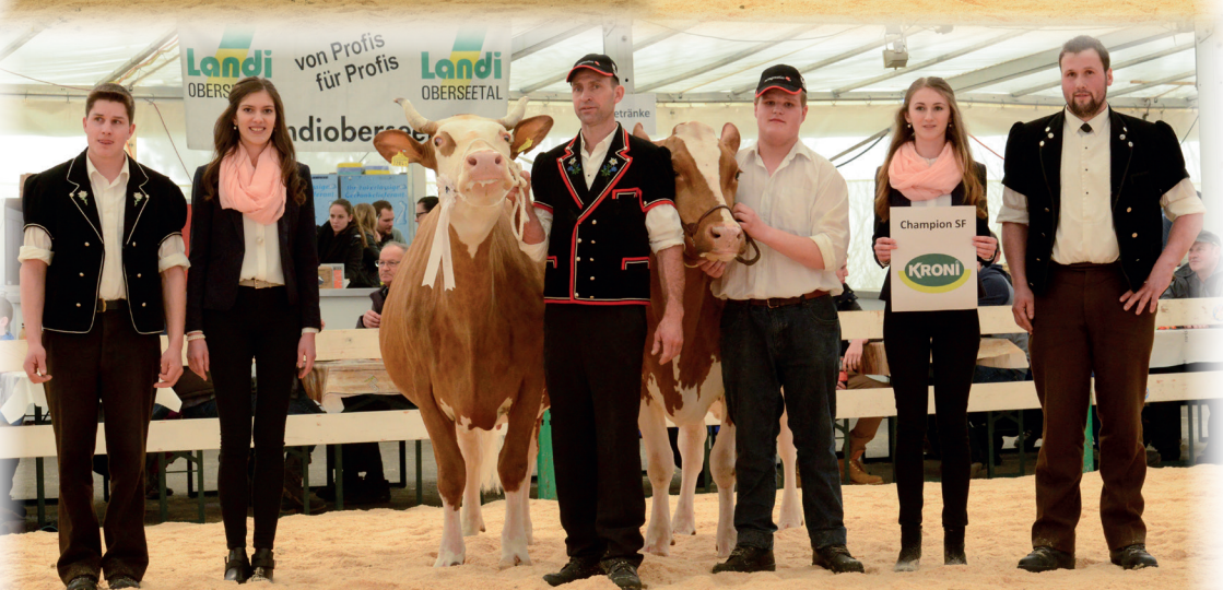
Impressionen der Lucerne Expo 2017